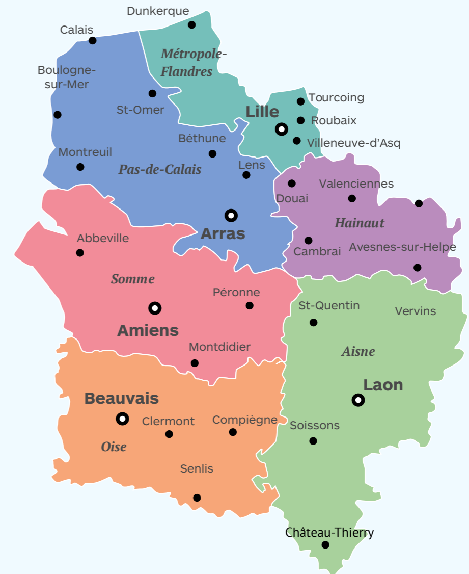
Les six territoires de démocratie sanitaire région Hauts-de-France